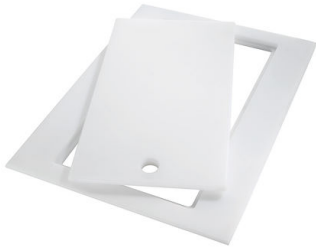
Tagliere Twin in HDPE 8644 101