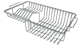
Cestello portapiatti inox 8100 201