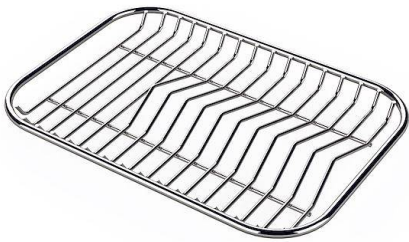
Griglia portapiatti inox 8100 154