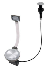
Piletta automatica Space Push - PP 8407 116